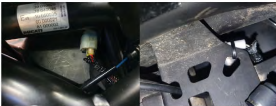
Links vorne unterm Tank geschaltet +12V FREIER STECKER

Es gibt 2 Möglichkeiten: Links vorne am Tank ( Leerstecker , Sumitomo Stecker gibt es im Shop) oder wie hier unter der Sitzbank . Geschaltetes Plus von der USB Steckdose. ( Sumitomo MT Sealed Typ IL //Stecker leider sehr schwer zu bekommen) Habe ein Y mit Japan Rundstecker eingebaut um die USB Dose weiter nutzen zu können.